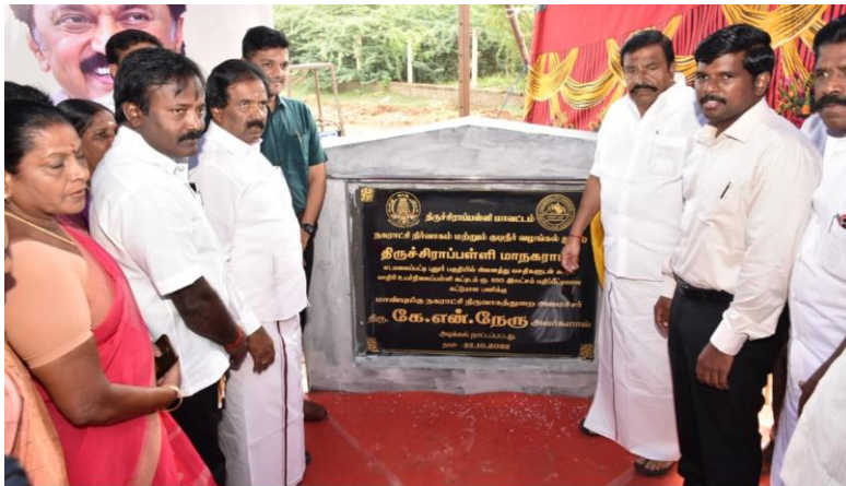
திருச்சிராப்பள்ளி மாநகராட்சி, எடமலைப்பட்டிப்புதூர் ராஜீவ் காந்தி நகர் பகுதியில் ரூ.650 இலட்சம் மதிப்பீட்டில் புதிய பள்ளிக் கட்டிடத்திற்கு மாண்புமிகு நகராட்சி நிருவாகத்துறை அமைச்சர் திரு.கே.என்.நேரு அவர்கள் இன்று (22.10.2022) அடிக்கல் நாட்டி திட்டப்பணிகளை தொடங்கி வைத்தார்.

வார்டு எண்.57க்குட்பட்ட எடமலைப்பட்டிப்புதூர் மாநகராட்சிப் பள்ளியில் தனியார் பள்ளிகளுக்கு இணையாக மாணவர்கள் சேர்க்கை இருப்பதால், அதற்கேற்ப கூடுதல் வசதிகள் வழங்கும் பணிகளை ரூ.650.00 இலட்சம் மதிப்பீட்டில் மேற்கொள்ளும் பணி துவங்கப்பட்டுள்ளது.