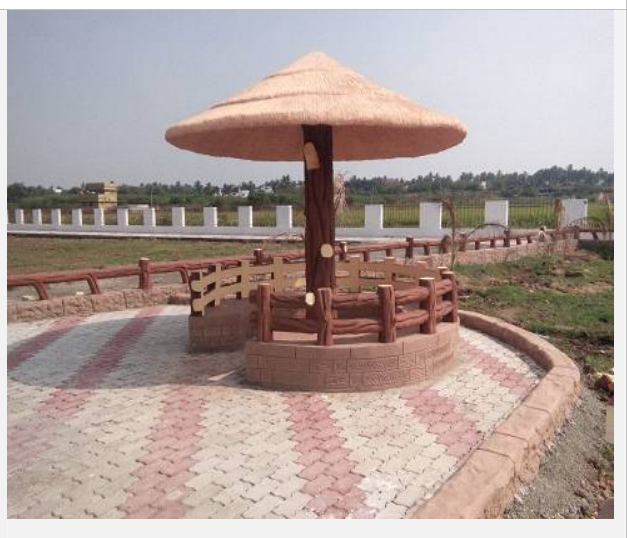
This is certified that, the above park has been completed and put in use for public

Commissioner lagercoil city municipal corporation