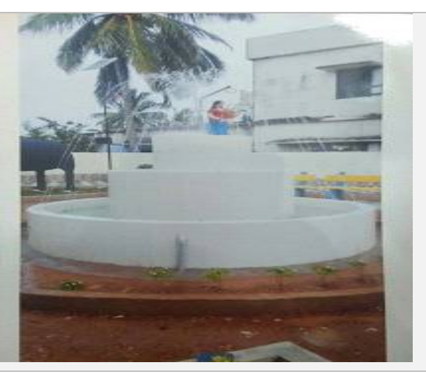
This is certified that, the above park has been completed and put in use for public