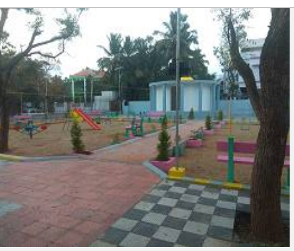
This is certified that, the above park has been completed and put in use for public

Commissioner Nagercoil city-municipal corporation