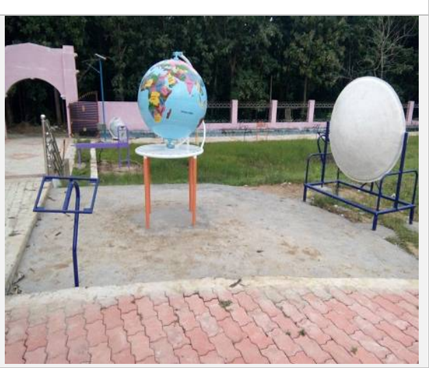
This is certified that, the above park has been completed and put in use for public